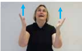
und die Herrlichkeit