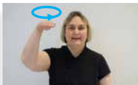
ist das Reich