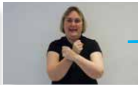
sondern erlöse uns